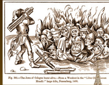
Fig. 302.—The Jews of Cologne burnt alive.—From a Woodcut in the “Liber Chronicarum Mundi:” large folio, Nuremberg, 1492.

La mayor parte de Europa persiguió severamente a los judíos durante la Edad Media. En ese momento de la historia, Europa estaba fracturada, en gran parte ignorante y en crisis constante. Fue víctima de plagas devastadoras y produjo poco de algún significado cultural o intelectual. Esta fue la "Edad Oscura" de Europa.