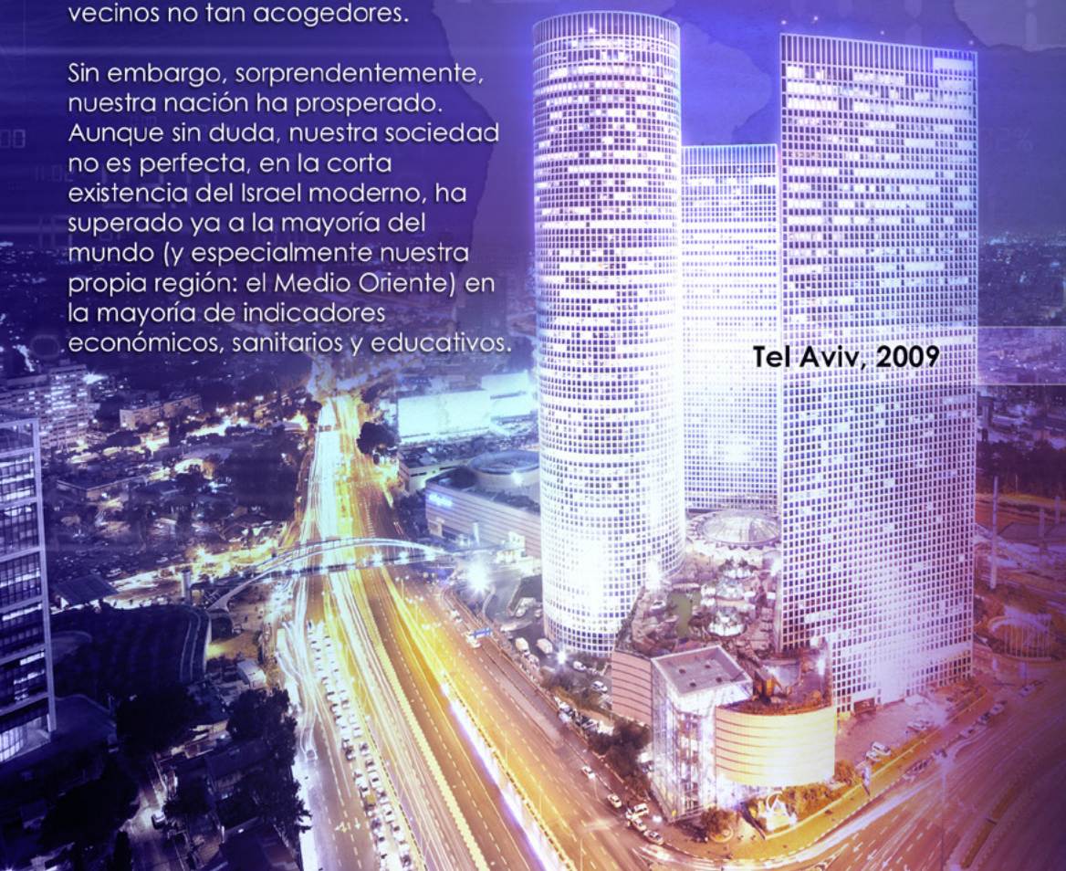
Tel Aviv, 2009

Sin embargo, sorprendentemente, nuestra nación ha prosperado. Aunque sin duda, nuestra sociedad no es perfecta, en la corta existencia del Israel moderno, ha superado ya a la mayoría del mundo (y especialmente nuestra propia región: el Medio Oriente) en la mayoría de indicadores económicos, sanitarios y educativos.