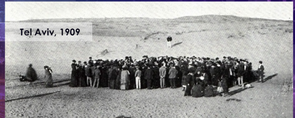
Tel Aviv, 1909

Pese a los boicoteos por la mayoría de nuestros vecinos en el Medio Oriente, nuestra pequeña nación exportó $98,7 billones en mercancías en el 2014; substancialmente más por habitante que los Estados Unidos, la Unión Europea y Japón. ¡Increíblemente, esto marca un aumento de casi 17,000 veces en las exportaciones desde 1948! 24